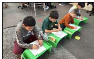
Portable lap desks