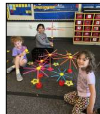
Herramientas de motricidad fina